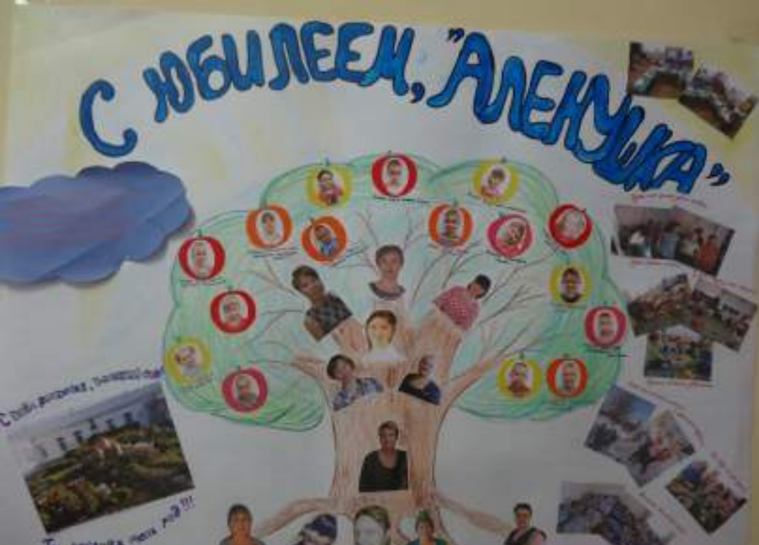
5 лет детскому саду