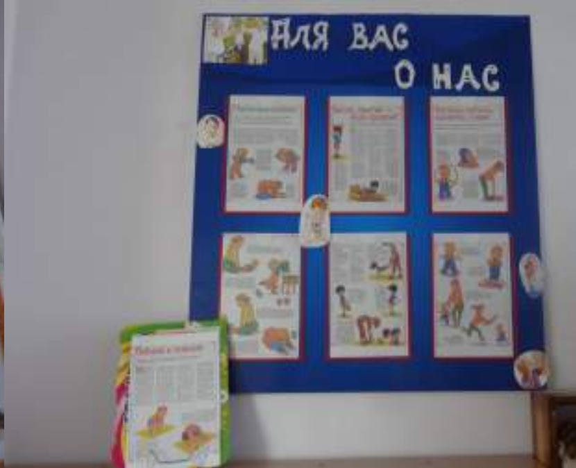
Наглядная информация в приёмной