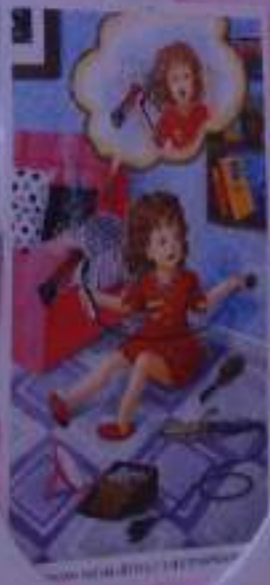
ИТОНА НЕ ДИНСИДЬАКЕТА

Сейчас мы будем учиться шить. Для этого нам нужно иметь швейную машинку. Мы будем шить платье. Для этого нам нужно иметь ткань и нитки. Мы будем шить платье. Для этого нам нужно иметь ткань и нитки.