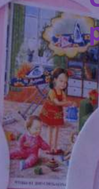
ИТОНА НЕ ДИНСИДЬАКЕТА

Сейчас мы будем учиться шить. Для этого нам нужно иметь швейную машинку. Мы будем шить платье. Для этого нам нужно иметь ткань и нитки. Мы будем шить платье. Для этого нам нужно иметь ткань и нитки.