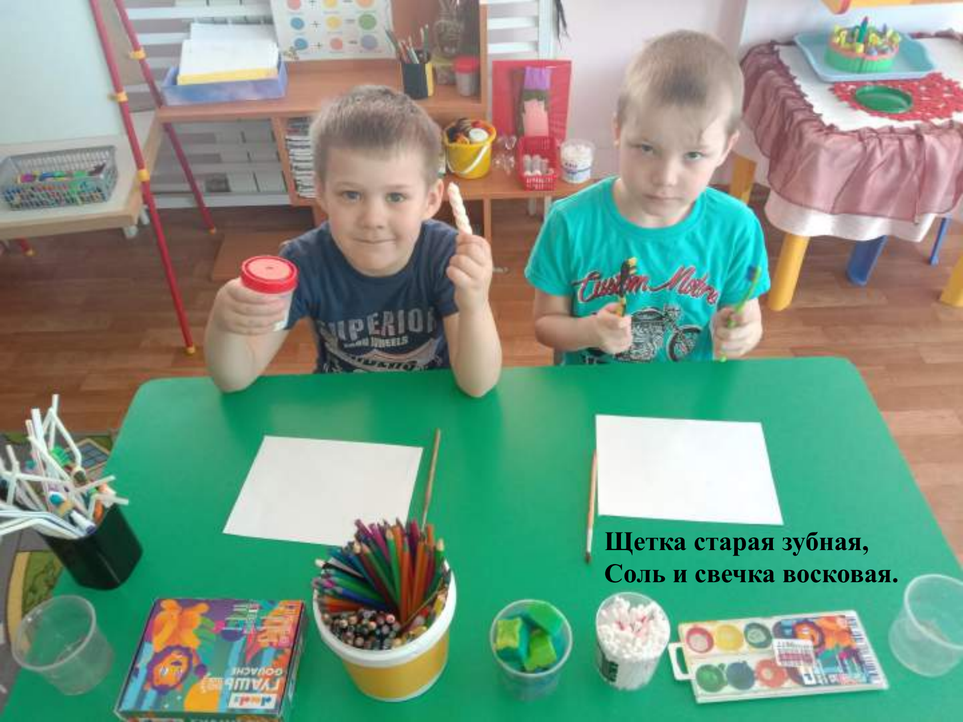
Щетка старая зубная, Соль и свечка восковая.