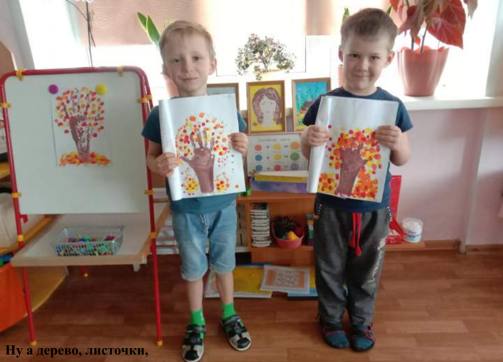
Ну а дерево, листочки, Рисуем пальцами, ладошкой.